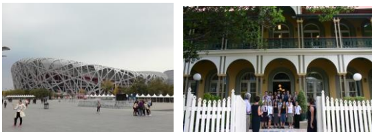
Carte européenne et internationale de Saint-Paul