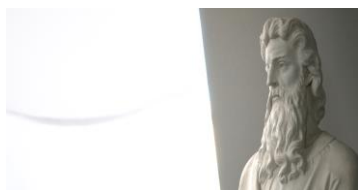
Un projet éducatif visible