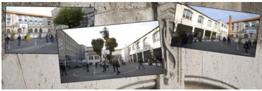
Le cycle de détermination