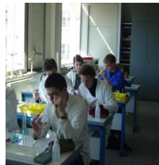
Un pôle scientifique