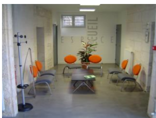
L'accès pour toutes les familles