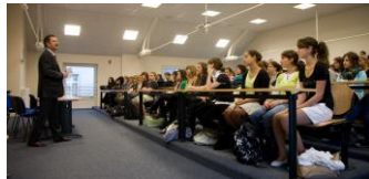
Choix des enseignements optionnels